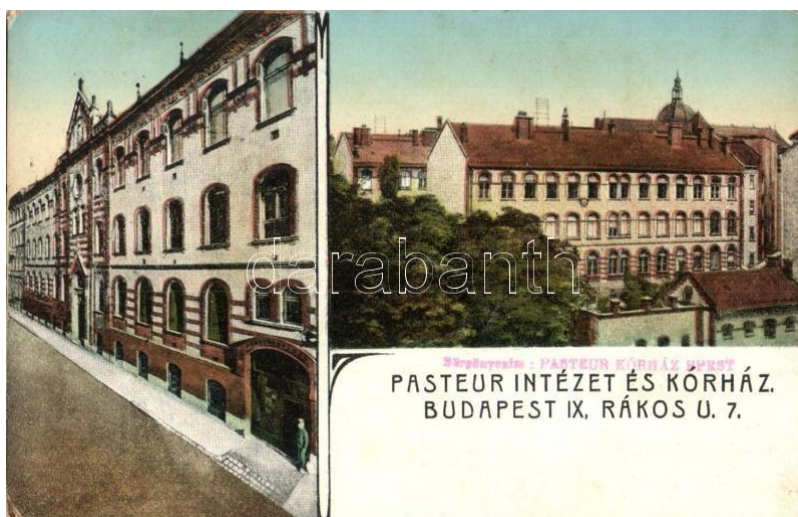
Az egykori Rákos utca ma Hőgyes Endre nevét viseli