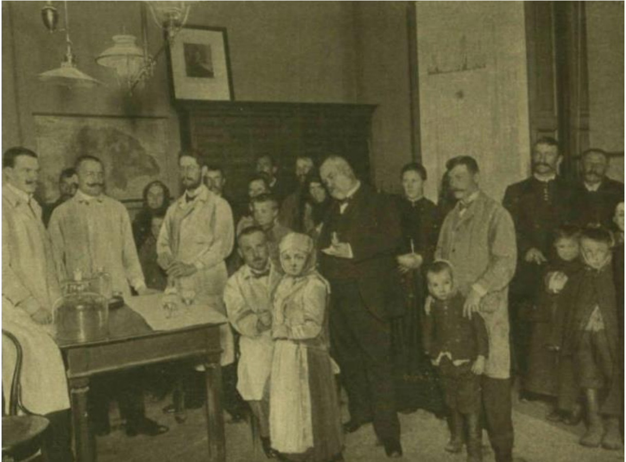
Egy veszett kutya által megmart kislány beoltása Hőgyes vezetésével