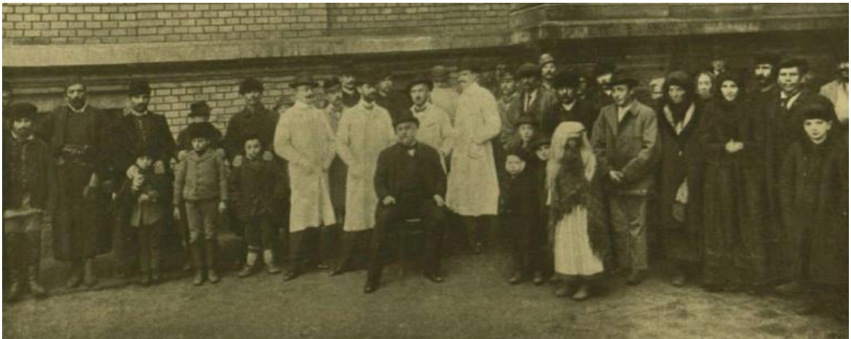
Hőgyes a Pasteur intézet segédorvosai és betegei között