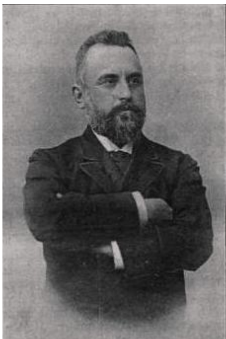
Hőgyes Endre 1892-ben

Iskolánk 1958-ban vette fel Hőgyes Endre nevét. 1972-ben iskolánk parkjában felállították Mezesz Tóth Gyula szobrászművész Hőgyest ábrázoló kőszobrát. Ugyanekkor Póka György művész tanár Hőgyes-plakettet készített, amelyet legjobb diákjaink a mai napig megkapnak a ballagásukon.