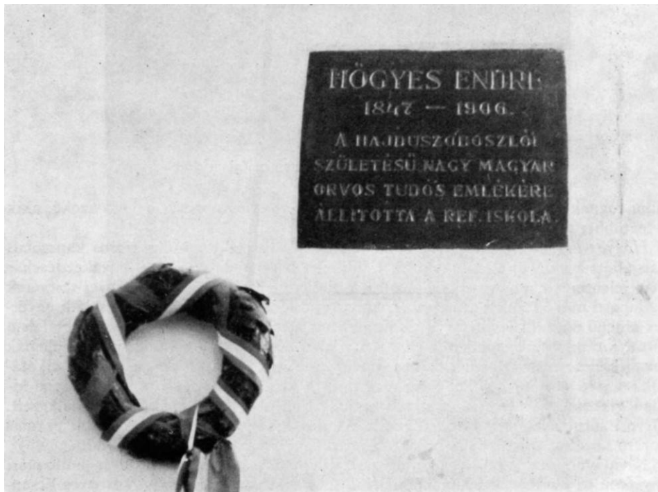
Emléktáblája az I. sz. /ma Gönczy Pál/ Általános Iskola falán

Nem sokkal halála előtt - az 1890-es évek végén - Hógyes tagja volt annak a sikerrel járt megyei, illetve szoboszlói küldöttségnek, amely a Vallás- és Közoktatásügyi Minisztériumban a községi polgári fiúiskola állami kezelésbe vételét sürgette. 1898-ban ennek eredményeként nyílt meg Hajdúszoboszlón az állami polgári fiúiskola. Bölcsőjénél tehát ott állott a már elismert egyetemi tanár is, mintegy kifejezve hűségét szülővárosa és kulturális törekvései iránt.