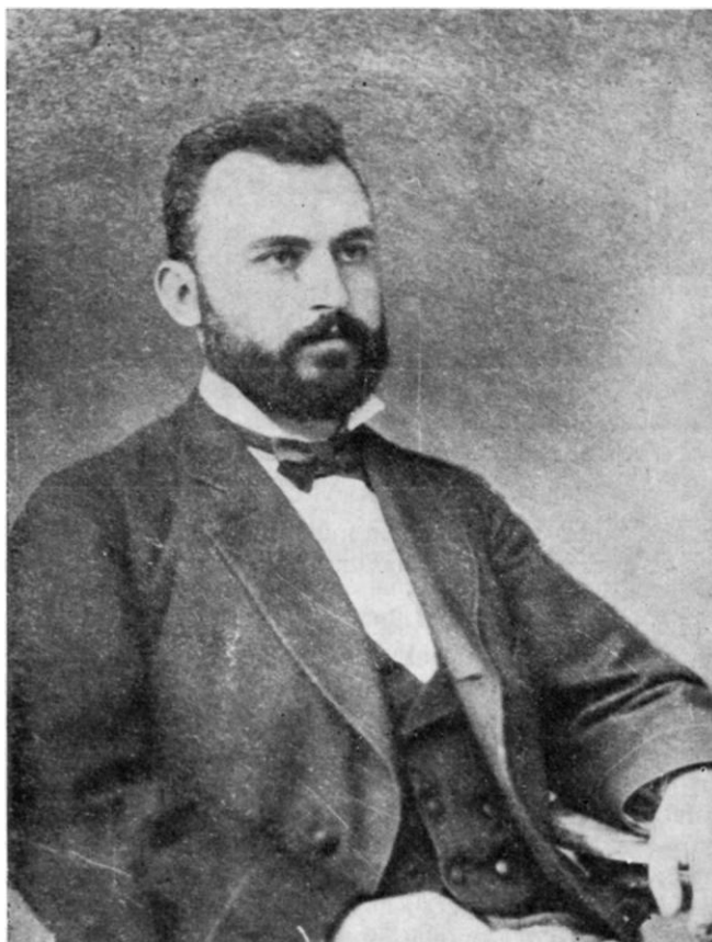
Hőgyes Endre (Hajdúszoboszló, 1847. november 30.-Budapest, 1906. szeptember 9.)