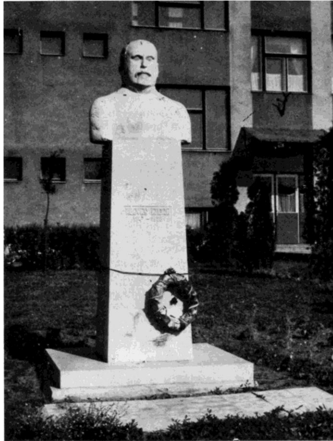
Szobra a róla elnevezett gimnázium előtt

A tudós szellemét, példáját követő intézmény magáévá tette és hirdeti a nagy névadó korunkhoz is méltó szavait: „... a tudomány és a béke előbb utóbb győzedelmeskedni fog a tudatlanság és a háború felett és a világ különböző népei egyesülni fognak nem a rombolás, hanem az építés gondolatában és a jövő azoké, akik a legtöbbet tesznek a szenvedő emberiségért”.